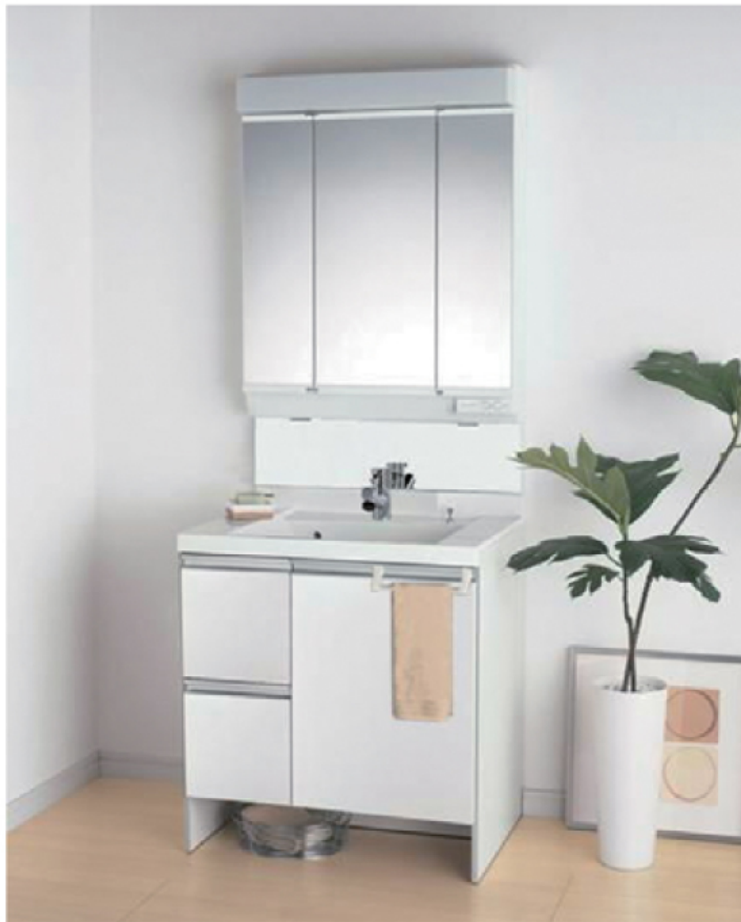
※イメージ写真です。