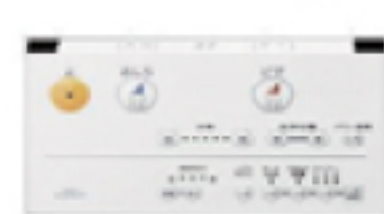
ウォシュレット用リモコン